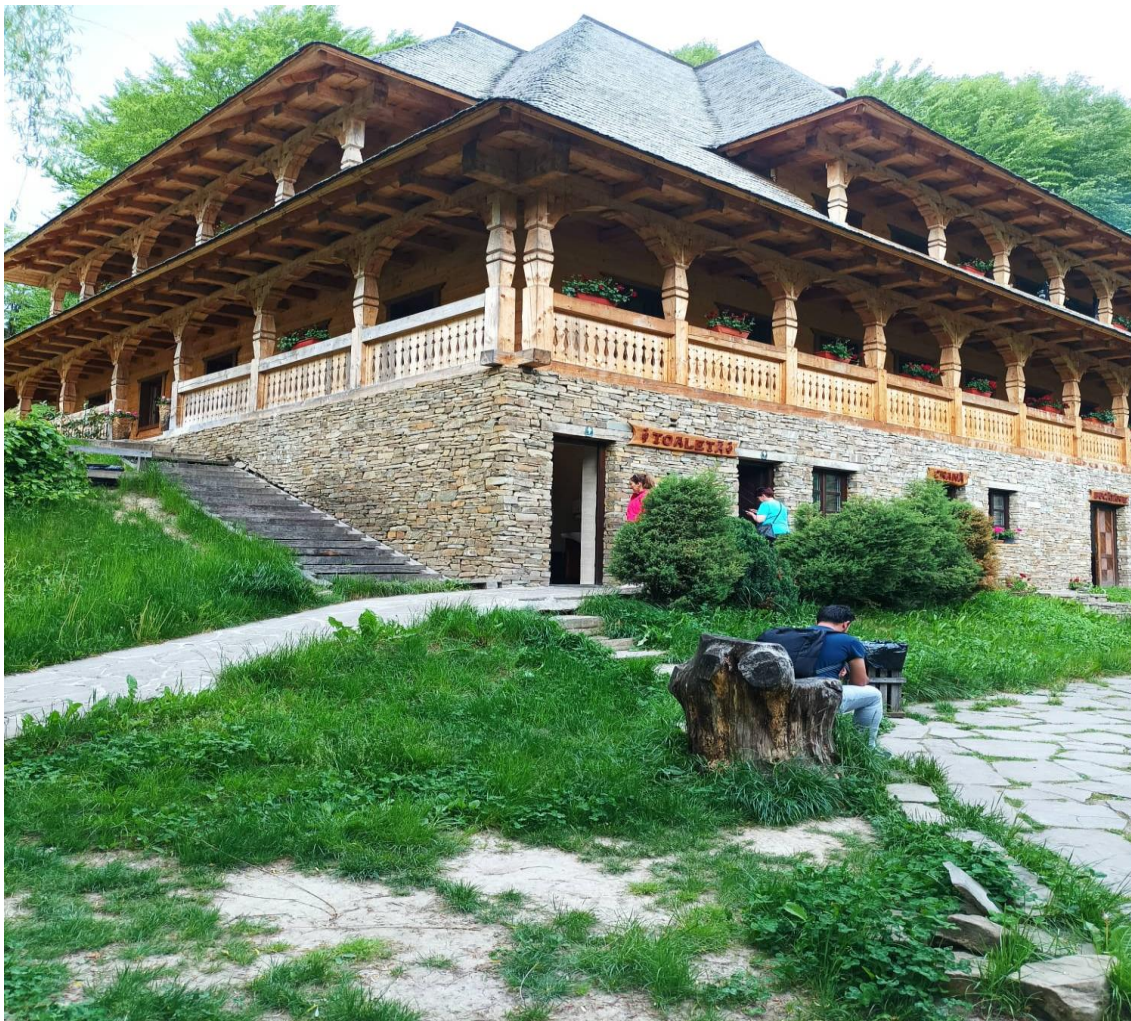
Krácsfalva Pizstrángos vendéglő

Máramarosszigetről a szállásunk felé megálltunk a krácsfalvai pizstrángosnál. Ez egy étterem, ahol a helyi pizstrángos tóból kifogott pizstrángot megsütik és frissen tálalják. A tavat egy kisebb vízesés táplálja. A sült pizstrángot a vízesés zúgását hallgatva fogyaszthatjuk el.