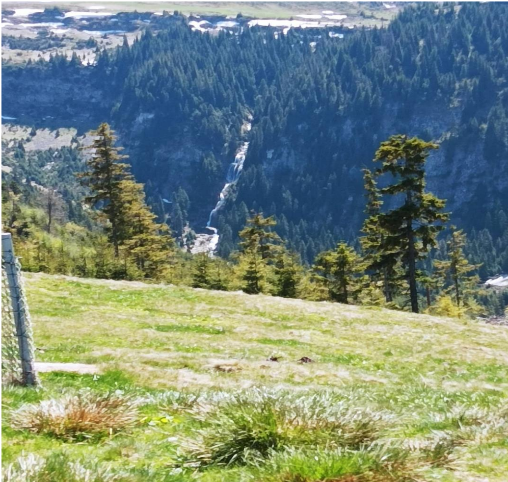
A Lóhavas vízesés