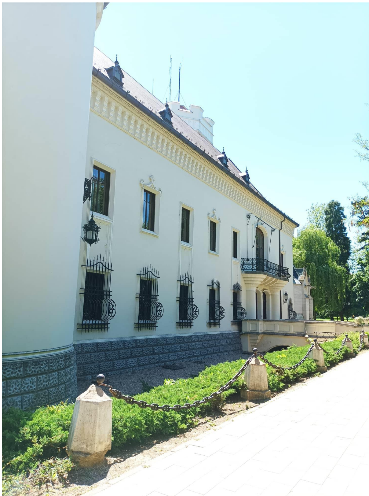
A Károlyi- kastély