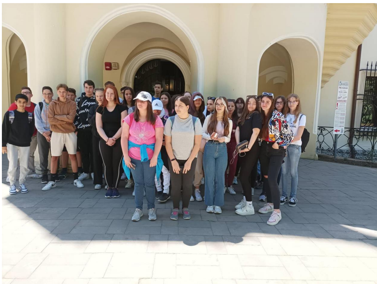
A Károlyi-kastély bejárata előtt

1. nap: Utazásunkat a Partiumban, Nagykároly városában kezdtük, amely a történelmi Szatmár vármegyéhez tartozott, ma pedig a romániai Szatmár megye egyik patinás városa. Az egykor színmagyar város lakosságának 60%-a még magyarnak vallotta magát a 2011-es népszámláláskor. A város nevezetessége a Károlyi grófi család neogótikus, neobarokk stílusban épült kastélya és hatalmas parkja, amelyben több száz évet is megélt fa található. A park a helyiek kedvenc pihenő helye. Mi is sétáltunk az árnyas fák alatt, hallgattuk a szökőkút csobogását és beszélgettünk a fiatalokkal. A város egykori Aranyszarvas fogadóiban ismerkedett meg Petőfi Sándor és Szendrey Júlia egy 1846 őszen tartott megyebálon. A két fiatal egymásba szeretett, és egy év múlva már össze is házasodtak.