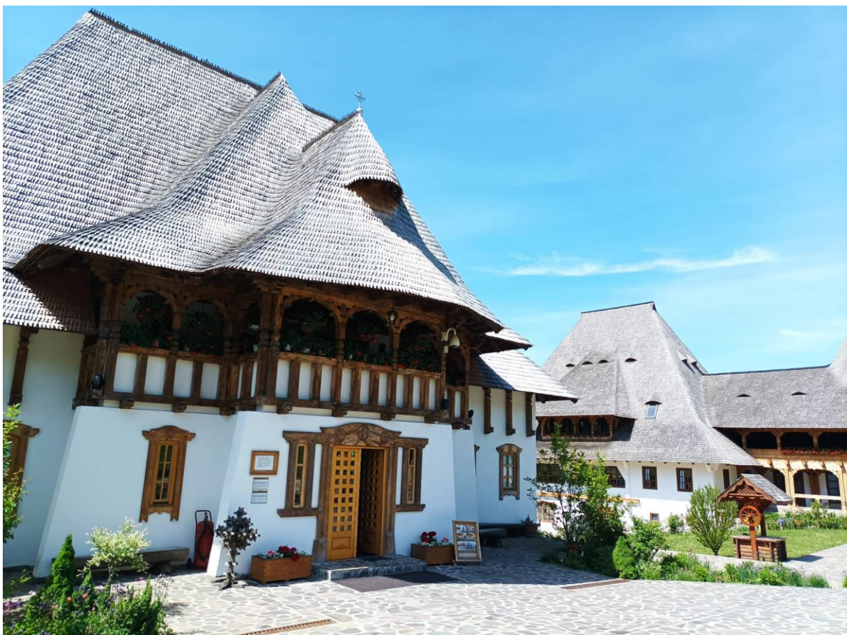
Barczánfalvai ortodox kolostor

család, amelynek legalább egy tagja ne dolgozna külföldön: Franciaországban, Spanyolországban vagy Olaszországban. Szinte csak látogatóba jönnek haza évente néhány hétre. Akik itt maradtak, főleg turizmusból és pálinkafőzésből élnek. Az állattenyésztés a rendszerváltás után szinte teljesen megszűnt, amely régen a fő megélhetési forrást jelentette. Máramaros vármegye sohasem volt magyar többségű. Ma is csak a lakosságnak mintegy 9 %-a magyar. IV Béla királyunk a tatárjárás után behívta a román pásztorokat, akik itt megtelepedtek és sikerrel védték az északi határokat hol a tatároktól, hol más hódítani vágyóktól. A történelmi Máramaros vármegye székhelye Máramarossziget volt, ez a város most a Tisza innenső partján, az ukrán határnál fekszik. A megye egy része most Ukrajnához tartozik. A megyeszékhely Nagybánya lett, amely régen Szatmár vármegyéhez tartozott. A határmódosítások következtében a romániai megyék határai is kicsit máshol húzódnak, mint az egykori magyar vármegyéké.