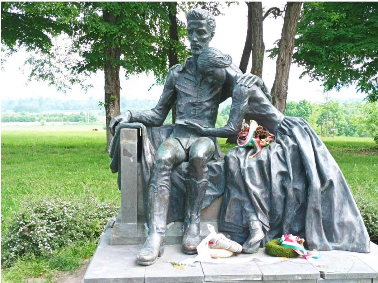
Petőfi Sándor és Szendrey Júlia szobra a koltói Teleki kastély parkjában

falépcső és a díszesen faragott famennyezet eredeti. Ma itt működik a Petőfi Sándor Általános Iskola. 10-12 magyar gyerek tanul egy-egy osztályban. A tanáraik nagy szeretettel oktatják őket. Minden év szeptemberében megtartják a Magyar lélek ünnepét, amelyen a diákok a falu lakosaival közösen magyarságukról és Petőfiről emlékeznek meg. A mi nyolcadikosainkkal egyből megtalálták a közös nyelvet, ami természetesen a foci volt. Talán napestig is rúgták volna bőrt, ha nem kellett volna felkerekednünk, hogy megcsodáljuk Máramaros egyik természeti csodáját, a Lóhavasi-vízesést.