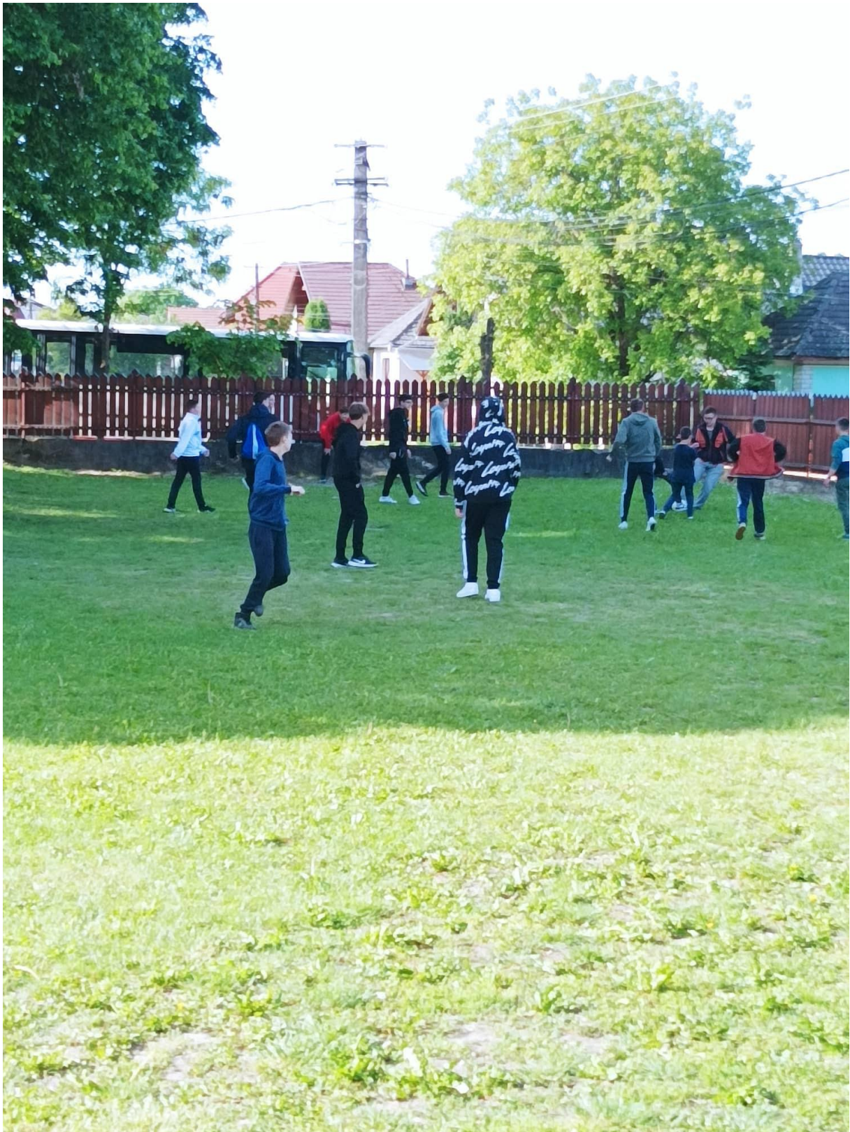
Közös foci a koltói Petőfi Sándor Általános Iskola diákjaival

A Lóhavasí- vízésés nyolevan méter magasról zúdul alá a Radnai-havasokból, amelyet az ott összegyűlt hó táplál, hogy aztán az Iza folyó vize elvigye a Tiszába. A Radnai-havasok és a Máramarosi- havasok a Keleti- Kárpátok hegyvonulatai. Itt található a Nagy- Pietrosz csúcs is, amit akkor, a „kis magyar világban”, amikor egy rövid időre visszakerült Észak-Erdély