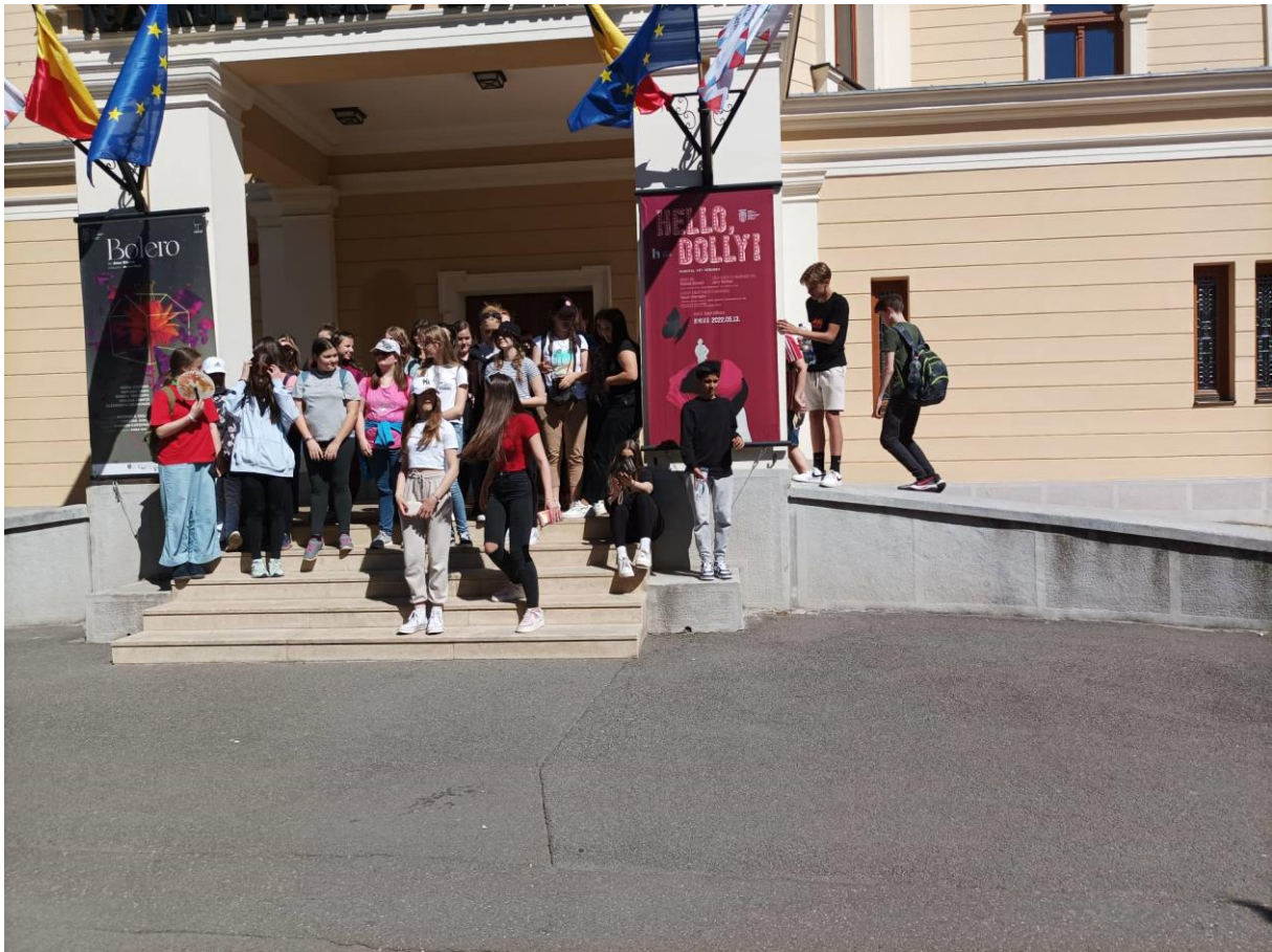
Szatmárnémeti Északi Magyar Színház

A következő város Szatmárnémeti volt, amelynek már csak mintegy 37%-a magyar. A városban jól megférnek egymás mellett a különböző felekezetek. A reformátusok temploma a híres Láncos templom, mellette a Református Főgimnáziumban magyar anyanyelven tanulhatnak a diákok. Innen nem messze található az Urunk mennybemenetele, ismertebb nevén a Nagytemplom, amely a római katolikusok temploma, de van itt magyar színház is, amely az Északi Színház nevet viseli és tűzoltó torony is, amelyre 175 lépcsőfokon lehet feljutni, ha gyönyörködni akarunk a város panorámájában. Mondanom sem kell, hogy mi bevállaltuk. Megérte. A Vécsey-ház szintén magyar vonatkozású, hiszen a Rákóczi szabadságharcot lezáró békét azon a helyen írták alá, ahol most ez a ház áll. Ma szépművészeti kiállítás található benne.